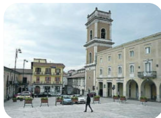
Museo della Civiltà Normanna